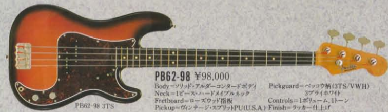
PB62-98 ¥98,000 Body=ソリッド・アルダー・コンタッドボディ Neck=1ピース・ハードメイプルネック Fretboard=ローズウッド指板 Pickup=ヴィンテージ・スプリットPU(U.S.A.) Pickguard=ベッコウ柄(3TS/VWH) 3プラインホワイト Controls=1ボリューム、1トーン Finish=ラッカー仕上げ Color=3TS/BLK/VWH/CAR

PB57-75 PROFILE エレクトリックベースのさきかたしてエポックを築き、ロックンロールを征してきた57年プレジジョンの完全レプリカPB57-75。永遠に新しい、アトミックエイブの機能的なプロポーション。芯の一本通った力強い太いトーンキャラクター。センセーショナルなパワフルサウンドはトラッドな雰囲気が見事に融合したエレクトリックベースのオリジナル、プレジジョン。