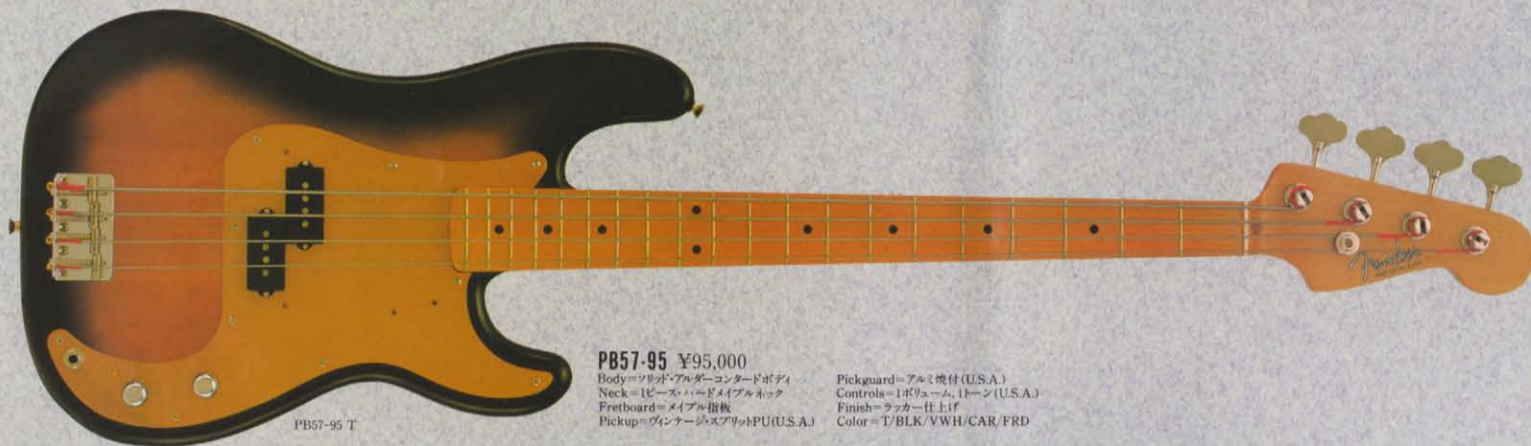
PB57-95 ¥95,000 Body=ソリッド・アルダー・コンタッドボディ Neck=1ピース・ハードメイプルネック Fretboard=メイプル指板 Pickup=ヴィンテージ・スプリットPU(U.S.A.) Pickguard=アルミ焼付(U.S.A.) Controls=1ボリューム、1トーン(U.S.A.) Finish=ラッカー仕上げ Color=T/BLK/VWH/CAR/FRD