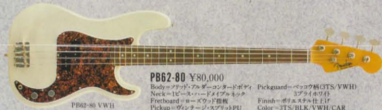
PB62-80 ¥80,000 Body=ソリッド・アルダー・コンタッドボディ Neck=1ピース・ハードメイプルネック Fretboard=ローズウッド指板 Pickup=ヴィンテージ・スプリットPU Pickguard=ベッコウ柄(3TS/VWH) 3プラインホワイト Finish=ポリエスナル仕上げ Color=3TS/BLK/VWH/CAR