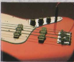
OPB54-75 ¥75,000 Body=ソリッド・アルダー・コンタッドボディ Neck=1ピース・ハードメイプルネック Fretboard=メイプル指板 Pickup=ヴィンテージOPB-PU Pickguard=1ピースホワイト(T) 1ピースブラック(BLD) Controls=1ボリューム、1トーン Finish=ポリエスナル仕上げ Color=T/BLD

OPB54-75 PROFILE すべてのエレクトリックベースに通ずる「基本」はこの一本から始まった。最初のエレクトリックベースこそ、このプレジジョンベースOPB'54-75なのだ。無駄がなく、気どったところもなく、スキのない端正なフォルム。そのサウンドは重く、タフで、ドライだ。テレキャスターに似たコケティッシュなヘッド、フラットなネック、特徴的なピックガードなどにじみ出るエレガンスは驚(ほど個人的であらう。