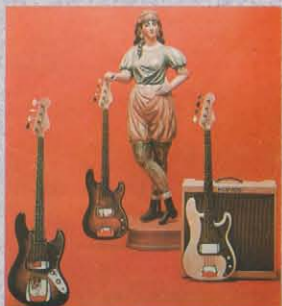
JB62-60 ¥60,000 Body=アルダーまたはバスのウッドボディ Neck=1ピース・ハードメイプルネック Fretboard=ローズウッド指板 Pickup=ヴィンテージPU×2(JAPAN) Pickguard=ベッコウまたは3プラインホワイト Controls=1ボリューム、2トーン Finish=ポリエスナル仕上げ Color=3TS/BLK/VWH/CAR