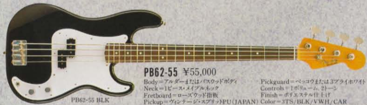
PB62-55 ¥55,000 Body=アルダーまたはバスのウッドボディ Neck=1ピース・ハードメイプルネック Fretboard=ローズウッド指板 Pickup=ヴィンテージ・スプリットPU(JAPAN) Pickguard=ベッコウまたは3プラインホワイト Controls=1ボリューム、1トーン Finish=ポリエスナル仕上げ Color=3TS/BLK/VWH/CAR

PB62-80 PROFILE 滑らかなフィンガータッチを約束するローズウッドフレットボード。'62年プレジジョンの美しいレプリカPB62-80。ミスターベースマンを唸らせるしなやかな弾き応え、すきのないツリッドな重低音。シンプルなプロポーションに反比例した幅広い音楽性と卓越したライブ感覚。PB'62-98同様、リアリティあふれる克明なディテール、オリジナルスクリプトスタイルのデカールがベーシストを直撃する。