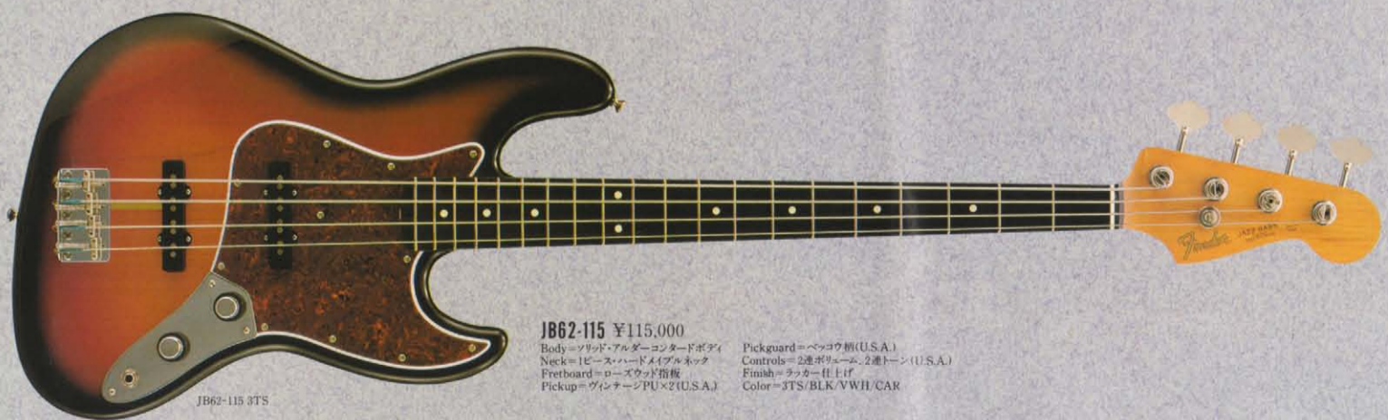
JB62-115 ¥115,000 Body=ソリッド・アルダー・コンタッドボディ Neck=1ピース・ハードメイプルネック Fretboard=ローズウッド指板 Pickup=ヴィンテージPU×2(U.S.A.) Pickguard=ベッコウ柄(U.S.A.) Controls=2ボリューム、2トーン(U.S.A.) Finish=ラッカー仕上げ Color=3TS/BLK/VWH/CAR

OPB54-75 PROFILE すべてのエレクトリックベースに通ずる「基本」はこの一本から始まった。最初のエレクトリックベースこそ、このプレジジョンベースOPB'54-75なのだ。無駄がなく、気どったところもなく、スキのない端正なフォルム。そのサウンドは重く、タフで、ドライだ。テレキャスターに似たコケティッシュなヘッド、フラットなネック、特徴的なピックガードなどにじみ出るエレガンスは驚(ほど個人的であらう。