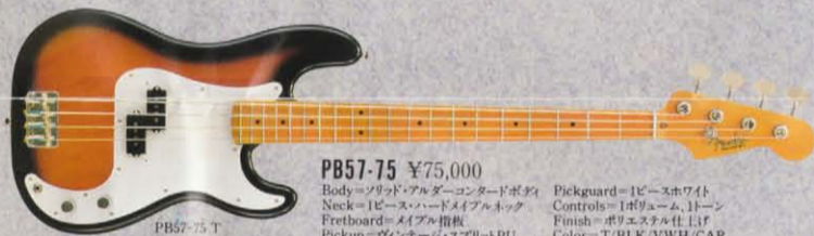
PB57-75 ¥75,000 Body=ソリッド・アルダー・コンタッドボディ Neck=1ピース・ハードメイプルネック Fretboard=メイプル指板 Pickup=ヴィンテージ・スプリットPU Pickguard=1ピースホワイト Controls=1ボリューム、1トーン Finish=ポリエスナル仕上げ Color=T/BLK/VWH/CAR