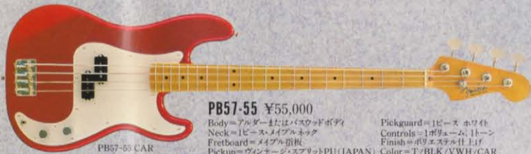
PB57-55 ¥55,000 Body=アルダーまたはバスのウッドボディ Neck=1ピース・ハードメイプルネック Fretboard=メイプル指板 Pickup=ヴィンテージ・スプリットPU(JAPAN) Pickguard=1ピース ホワイト Controls=1ボリューム、1トーン Finish=ポリエスナル仕上げ Color=T/BLK/VWH/CAR